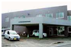
北海道礼文町国保船泊診療所は礼文町で唯一入院施設をもつ医療機関。町民約3,000人の健康をあづかっています。