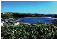
北海道の西北、稚内からフェリーで2時間のところに位置する礼文島。国立公園にも指定されており、大自然と海の幸を満喫できます！